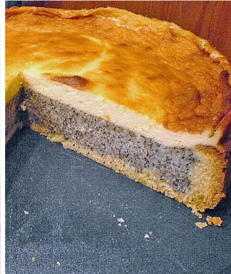
Figuur 1. Maanzaadcake welke zeer populair in Oost-Europese landen is, maar ook dicht bij huis: ook in Duitsland is maanzaadgebak een algemene lekkernij

Maanzaadstro bevat giftige stoffen afkomstig uit het melksap; het is ongeschikt voor cellulosebereiding, veevoer of strooisel. Het stro heeft daarom weinig tot geen waarde.