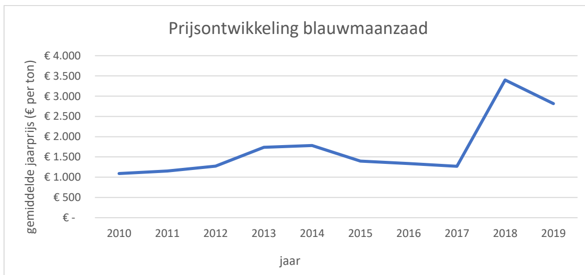
Figuur 2. Prijzontwikkeling blauwmaanzaad in de periode van 2010 tot en met 2019.

Dat de prijs van blauwmaanzaad over de jaren kan variëren blijkt uit figuur 2. In de afgelopen 10 jaar varieerde de prijs tussen € 1.000 en bijna € 3.500 per ton. Omdat maanzaad enkele jaren kan worden bewaard, kan de teelt van 2016 alsnog een hoog rendement in 2018 hebben opgeleverd.