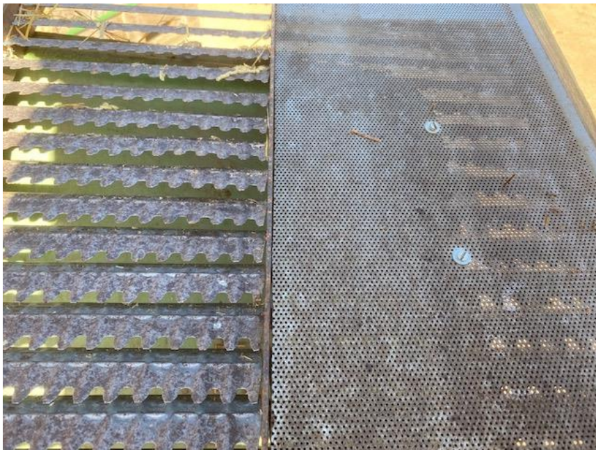
Figuur 3: Aanpassing van de bovenste zeef met geperforeerd plaatstaal.

Wie blauwmaanzaad schoon uit de combine wil hebben, kan overwegen om de bovenste zeef dicht te maken. Dit kan uitstekend met plaatstaal met perforaties van 1-1.5 mm.